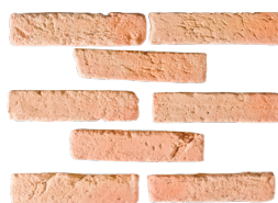
Parement L. 22 x h. 5 Épaisseur 2 cm