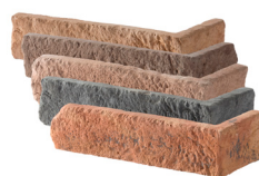
Angle L. 22 x l. 10 x h. 5 Épaisseur 2 cm