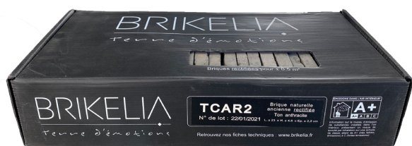
Boîte de 0.5 m 2 Brique Vintage La rectifiée