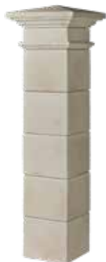
Kit pilier VALANCAY H.182 x L. 35 cm (pilier fini avec 5 boisseaux) H. 212 x L. 35 cm (pilier fini avec 6 boisseaux)