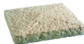
Chapeau de pilier BRIDOIRE L. 42 x l. 42 x h. 7 cm