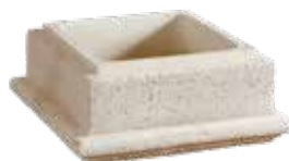
Colerette VALANCAY l. 40 x h. 15 cm