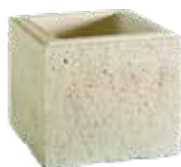
Boisseaux VALANCAY l. 35 x h. 30 cm