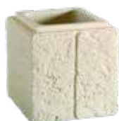
Boisseaux RENAISSANCE l. 30 x h. 30 cm l. 37 x h. 33 cm l. 47 x h. 33 cm