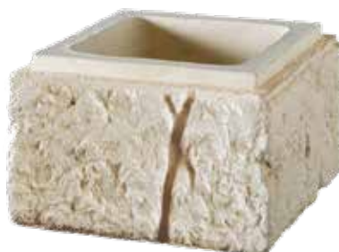
Boisseaux BRIDOIRE l. 35 x h. 20 cm