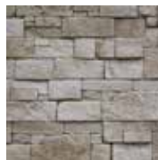
3 - J'hydrofuge pour l'extérieur