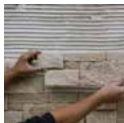
1 - Je pose en suivant le procédé IDEAPOSE et le calepinage