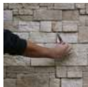
2 - J'élimine le surplus de colle