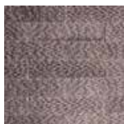
2 - J'hydrofuge

Calepinage = Façon de disposer les éléments de parement pour obtenir un ensemble harmonieux