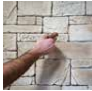
2 - J'élimine le surplus de colle