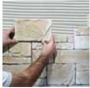
1 - Je pose en suivant le procédé IDEAPOSE et le calepinage