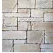
3 - J'hydrofuge

Calepinage = Façon de disposer les éléments de parement pour obtenir un ensemble harmonieux