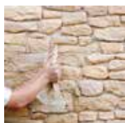
2 - Je réalise les joints