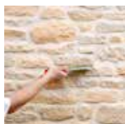
3 - Je brosse et j'hydrofuge

Calepinage = Façon de disposer les éléments de parement pour obtenir un ensemble harmonieux