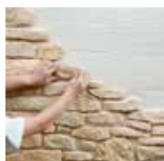
1 - Je pose en croisant les joints d'une rangée sur l'autre