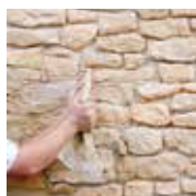
2 - Je réalise les joints