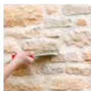
3 - Je brosse et j'hydrofuge

COLLAGE DES PAREMENTS ET ELEMENTS DE PAREMENT : Reportez-vous à la fiche IDEAPOSE