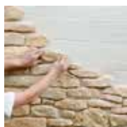
1 - Je pose en croisant les joints d'une rangée sur l'autre